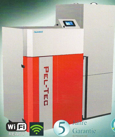
Pelletkessel PelTec-lambda 24 kW € 7.666,- inkl. Mwst.*